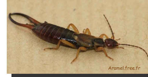
Perce-oreilles Forficula auricularia

Afin de nous permettre de nous reproduire tranquillement ou de nous aider à mieux passer l'hiver, mais aussi d'attirer de nouveaux locataires utiles aux écosystèmes, l'association des Ecologistes de l'Euzière et ses adhérents nous ont construit cet hôtel à insectes. Chaque casier est adapté aux besoins d'un groupe d'espèces particulier, afin de diversifier la clientèle de la maison.