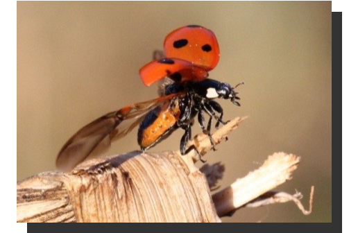
Coccinelle à 7 points Coccinella septempunctata