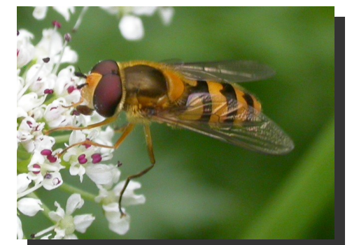
Syrphe Syrphidae sp.

Pour que cet hôtel reste attractif, merci d'en prendre grand soin et de le toucher avec les yeux !