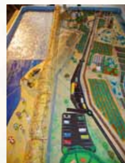
Maquette de la malle pédagogique, Lido de Sète (34).