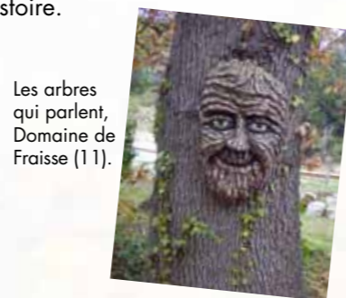
Les arbres qui parlent, Domaine de Fraisse (11).

Révéler au public l'esprit d'un lieu qu'il découvre, sa richesse écologique et son histoire.